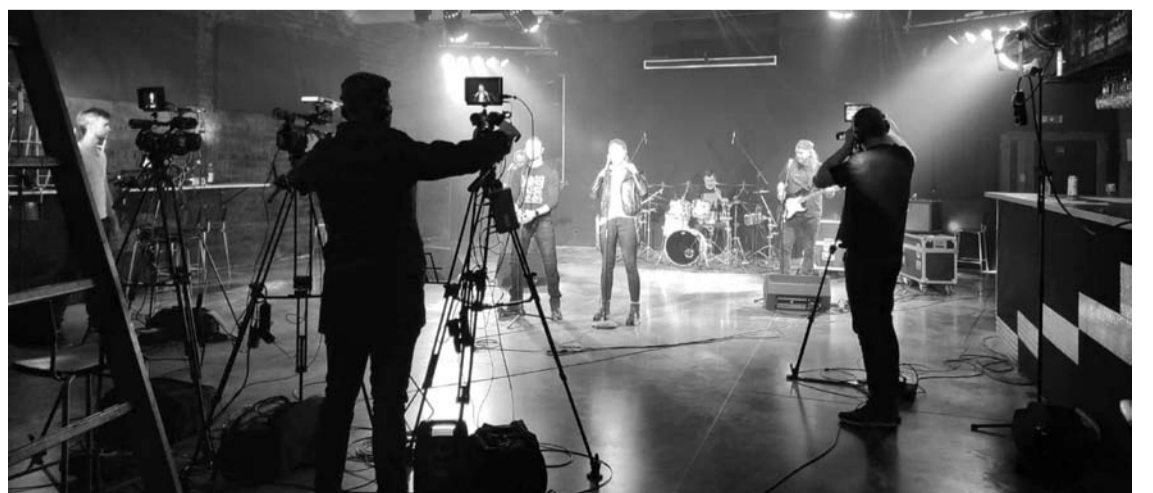
Koncerto filmavimo užkulisiai.

Groju su daug kuo. Kažkada skaičiavome su draugais: išėjo 26 „judesiai“ nuo heavy metal iki dainuojamosios poezijos, nuo paauglystės roko ištakų - grupės ŠEŠĖLIAI ar palaksty-mų sienomis su BLOGA REPU-TACIJA iki sunkiojo lietuviško roko legendų AUDRONAŠA ir PILIGRIMAS, pop muzikos ikonos L. Kernagio, atgimimo dainiaus A. Vilčinsko ar dar vis maištingo roko atlikejo Vlodo Kovaliovo. Teko dalyvauti įvai-riuose festivaliuose: „Pop Art“, „Kilkim žaibu“, „Šerną tūsas“, „Metelio banga“, o apie visokių nutikimų, nuėjimų ir pabanga-vimų istorijas galima būtų ne vieną knygą parašyti.