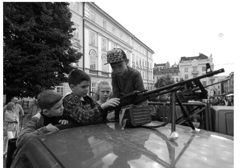
Vaikai domisi ginklais, kurie siunčiami Ukrainos kariams.

Vidaus reikalų ministras Denisas Monastirskis savo ruožtu perspėjo, kad artimiausiais mėnesiais per pusę gali padaugėti kriminalinių nusikaltimų – api-