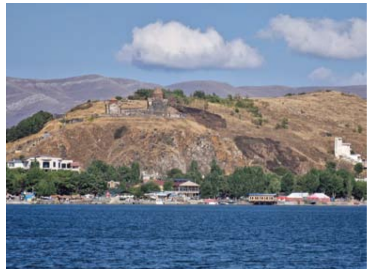
Sevanas - didžiausias Armėnijos ir visos Užkaukazės ežeras. Jo plotas - 1243 kv.km. Palyginimui - Anykščių rajono plotas 1765 kv.km.