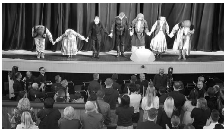
Į Lvivo dramos teatrą žiūrovų susirenka pilna salė.

Kai kurie Kijevo politologai teigia, jog Ukraina privalės Izraelio pavyzdžiu išmokyti gyventi ir klestėti egzistuojant potencialiam pavojui, kad Rusijos bet kada vėl gali būti užpulata. Ateityje gal taip ir bus, tačiau dabar nemaža dalis ukrainiečių dėl baimės ar vado-