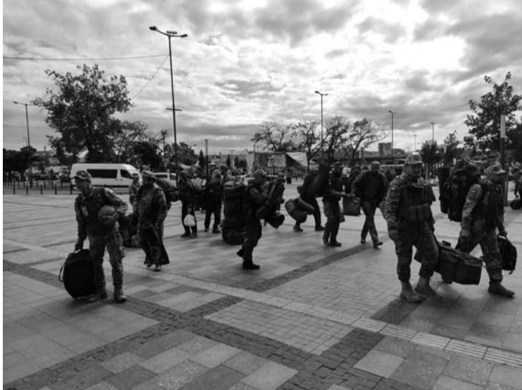
Kariai iš Lvivo stoties išvyksta į frontą.

Juolab kad jis po akimirkos paprašė, kad „žmogiškai“, o ne aptakiomis frazėmis paaiškčiau, kokia šiuo metu, įpusėjus septintam karo mėnesiui, yra situacija Ukrainoje.