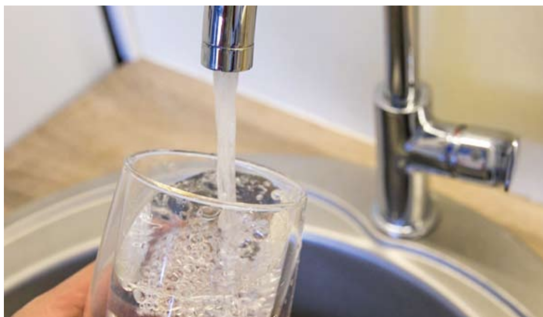
Vandens kaina Anykščių rajone yra viena didžiausių Lietuvoje.

Itin smarkiai augančios energijos kainos geriamojo vandens tiekimą brangins kartais, teigia Lietuvos vandens tiekėjų asociacija. Šios asociacijos narė yra ir UAB „Anykščių vandenys“. Didžiausi vandens kainų šuoliai prognozuojami mažose savivaldybėse, kur nėra daug vartotojų.