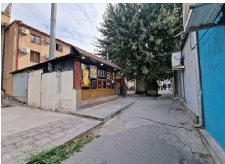
Įėjimas į mūsų „viešbutį“ Jerevano geležinkelio stoties rajone.