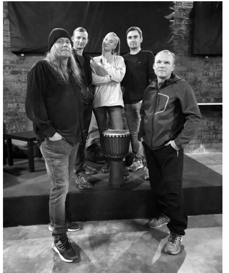
Projektas „Vėjai“ puoselėja roko muzikos barus.

- Esi kavarskietis, šiemet Kavarskas tapo Lietuvos kultūros mažąja sostine. Kaip sutikai šią žinią? Kaip vertini šio miestelio kultūrinį gyvenimą? Galbūt su muzikiniiais projektais yra tekę pasirodyti ir Kavarske? O gal klausytojai tave Kavarske pamatys ir išgirs šiemet?