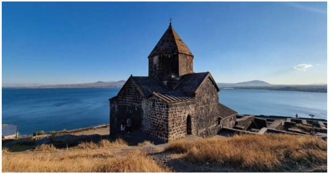
Sevano pusiasalyje stovintis Sevanavank vienuolynas buvo pastatytas tada, kai pusiasalis dar buvo sala.