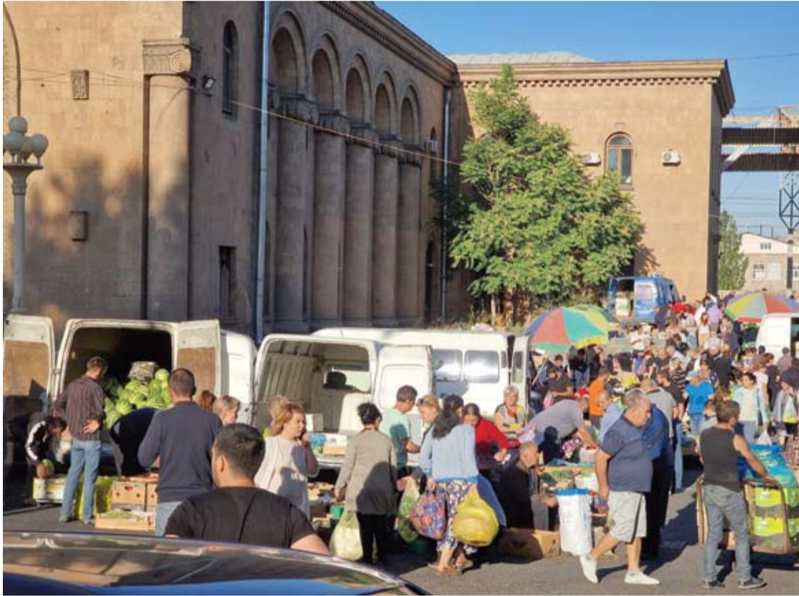
Prie Jerevano geležinkelio stoties rytais rikiuojasi vaisius ir daržoves atvežę ūkininkai. Didžiąją dalį jų produkcijos dideliais kiekiais nuperka kavinių ir parduotuvių atstovai.

Žmonai buvau žadėjęs ramiai ir patogiai kelionę. Sužinojus, kad atsidūrėme karo zonoje, pasidarė „nefaina“.